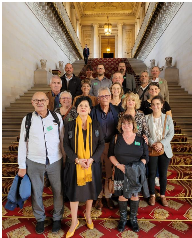
Visite du Sénat le 25 Octobre sur l'invitation de la Sénatrice Christine BONFANTI-DOSSAT