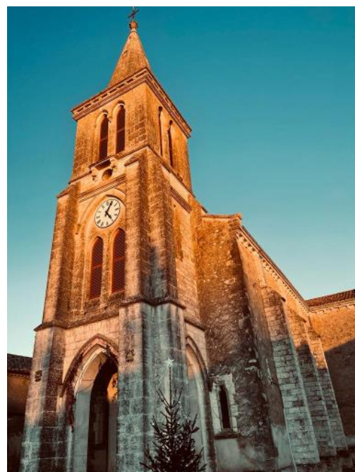
Janvier 2023 (paysage) et Décembre 2021 (église)